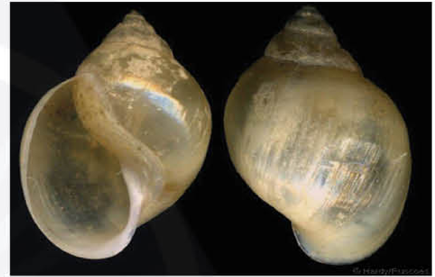
लिमनिया प्रजाति के घोघें

घोघें इस पर्णाभ के लिए मध्यवर्ती पोषक का कार्य करते हैं जिसमें परजीवी की कुछ अवस्थाओं का विकास होता है भारत में लिमनिया प्रजाति के घोघें मुख्यतः जिम्मेदार होते हैं